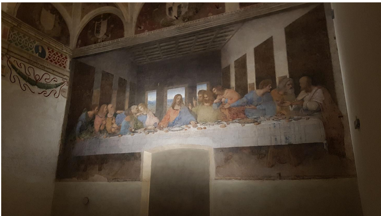
Leonardo Da Vinci: Den sidste nadver